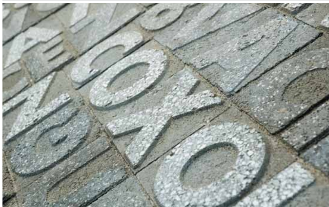
Il giardino delle parole, particolare. Azienda Formec a San Rocco al Porto, Lodi