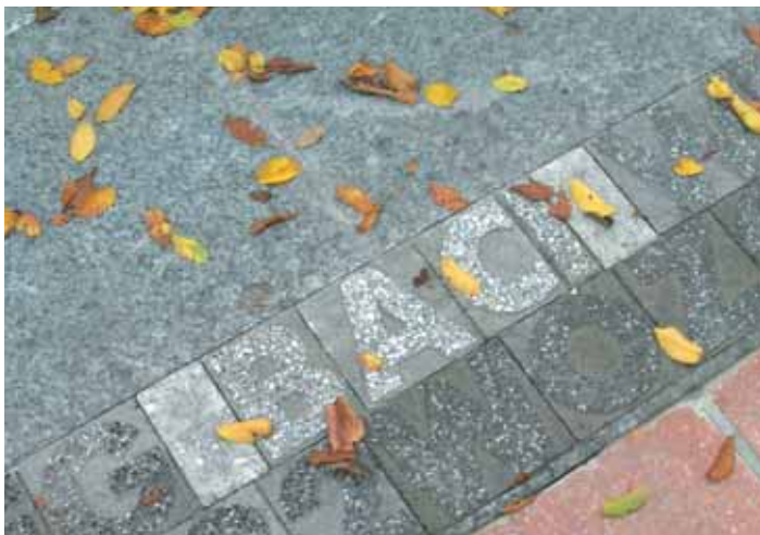
📍 Largo Baciocchi a Piacenza