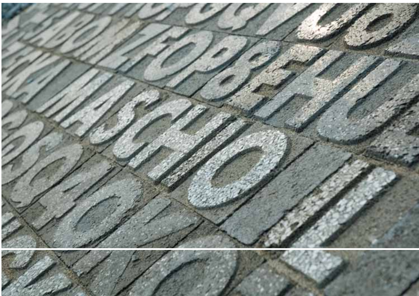
Largo Baciocchi a Piacenza

Con le lettere lignee di Gutenberg, Milani ha costruito portali e innalzato piccole torri postmoderne.