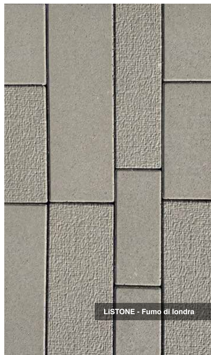
LiSTONE - Fumo di Londra