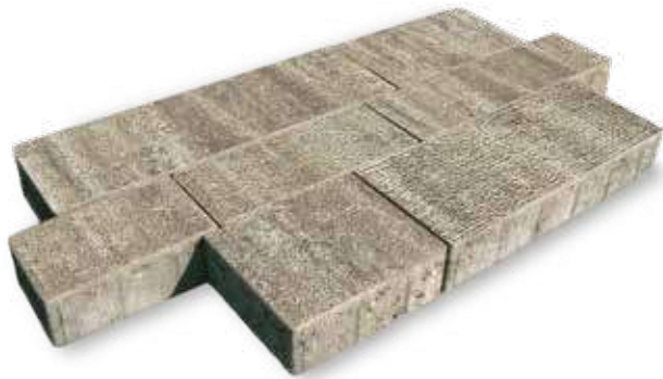
POSA A CORRERE SFALSATA