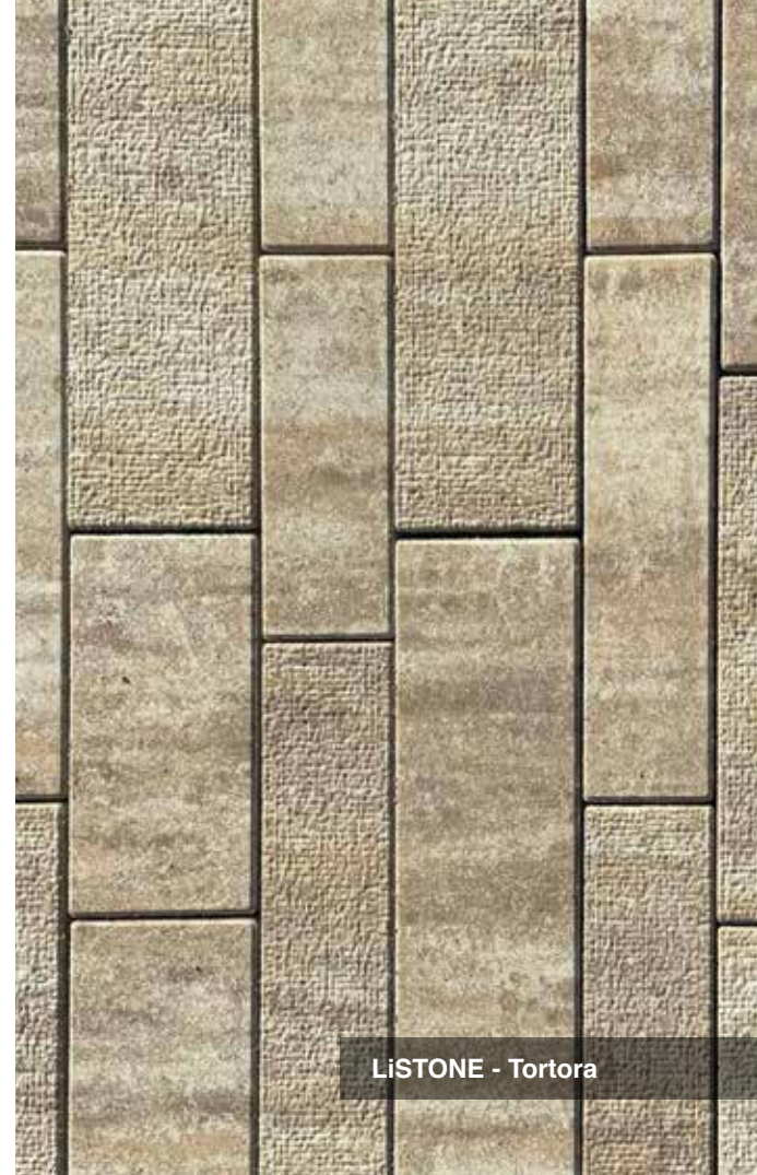
LiSTONE - Tortora